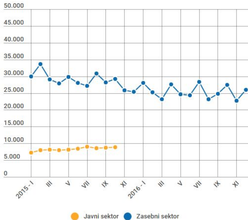
Graf: Število zaposlenih z minimalno plačo